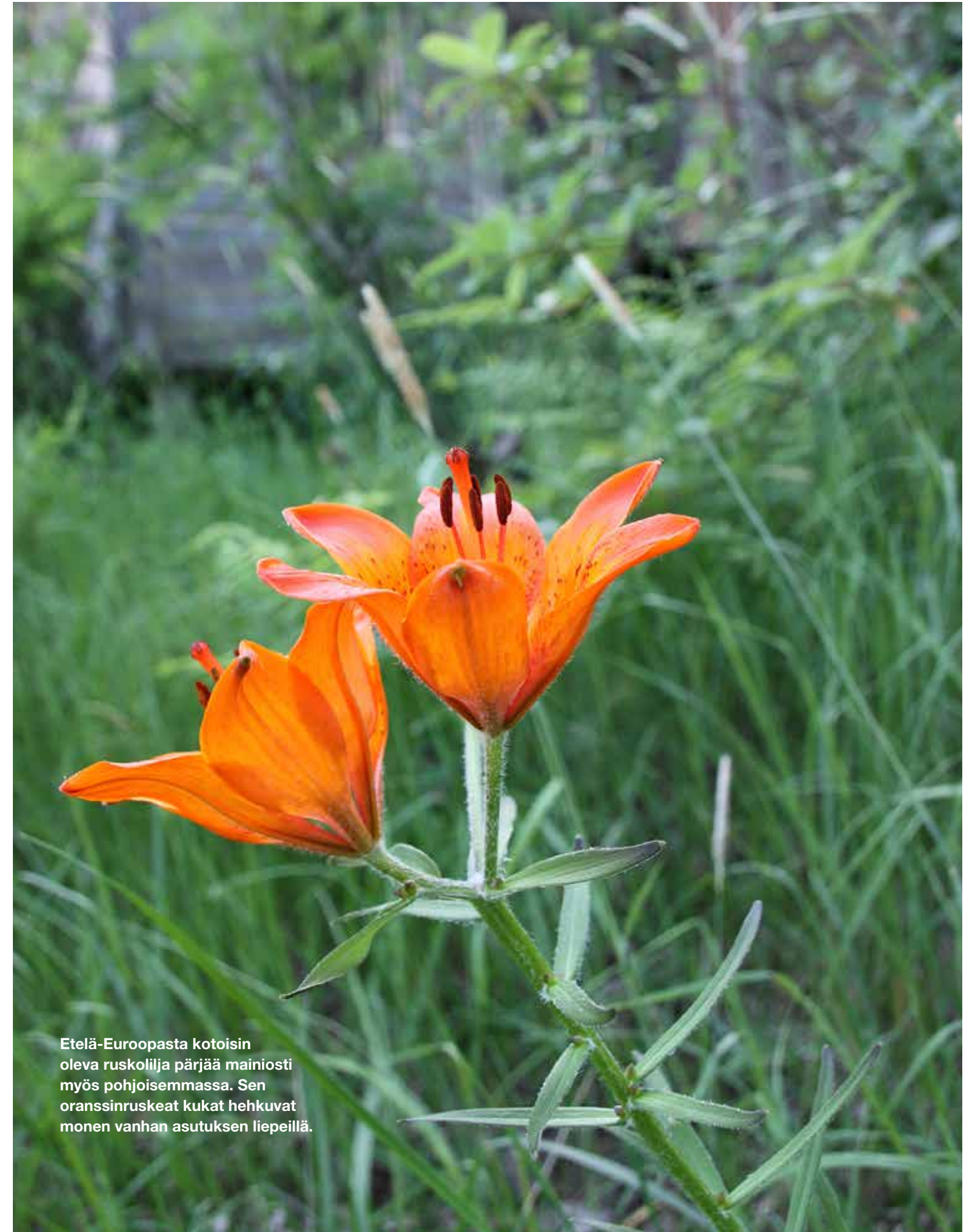
Etelä-Euroopasta kotoisin oleva ruskolilja pärjää mainiosti myös pohjoisemmassa. Sen oranssinruskeat kukat hehkuvat monen vanhan asutuksen liepeillä.