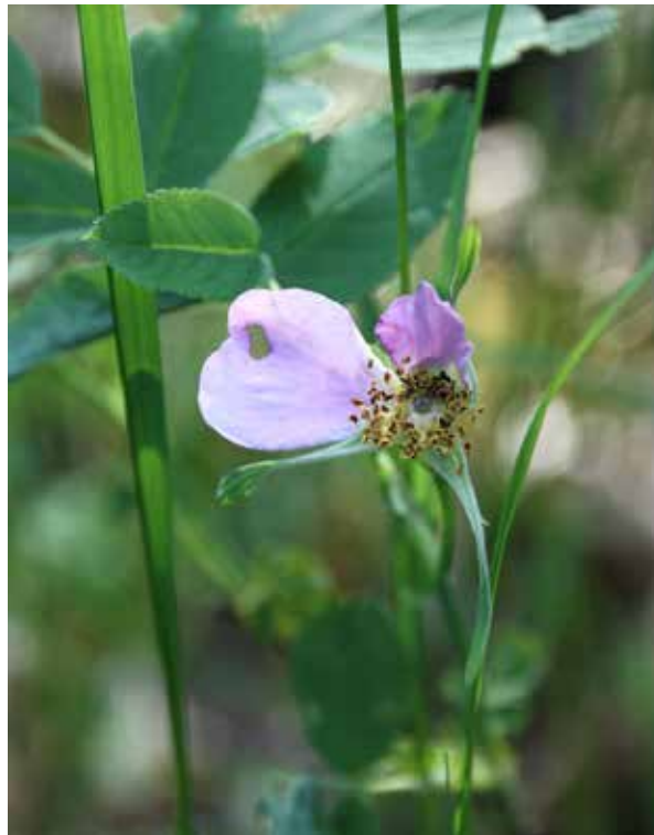
Jos metsäruusua ei kasvanut pihalla luonnostaan, sitä saatettiin siirtää kotipihaan koristeeksi lähimetsästä.

O ranssi läikkä erottuu kuin huutomerkki kesävihreän keskeltä. Ruskoliljan loistavan väriset, ylöspäin avautuvat kukkakellot ovat eksoottinen ilmentys jo puutarhassa. Kun kasvupaikkana on hiirenvirnaa, horsmaa ja timoteita kasvava pellonreuna, on näky suorastaan epätodellinen.