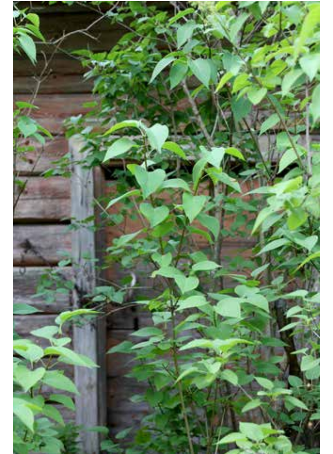
Tästä ovesta ei enää kuljeta.

Kukista taas saattoi valmistaa tuoksuvoittoa, mutta tällä tilalla moisille kotkotuksille oli tuskin tarvetta. Kun vain pistäytyi illalla pihalla, seinänvieruspenkissä kasvavan suopayrtin tuoksun tunsi kyllä nenässään. □