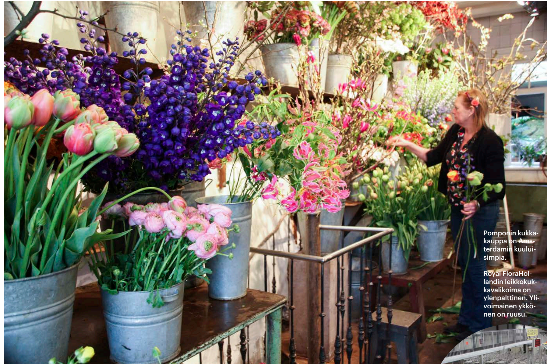
Pomponin kukkakauppa on Amsterdamin kuuluisimpia.