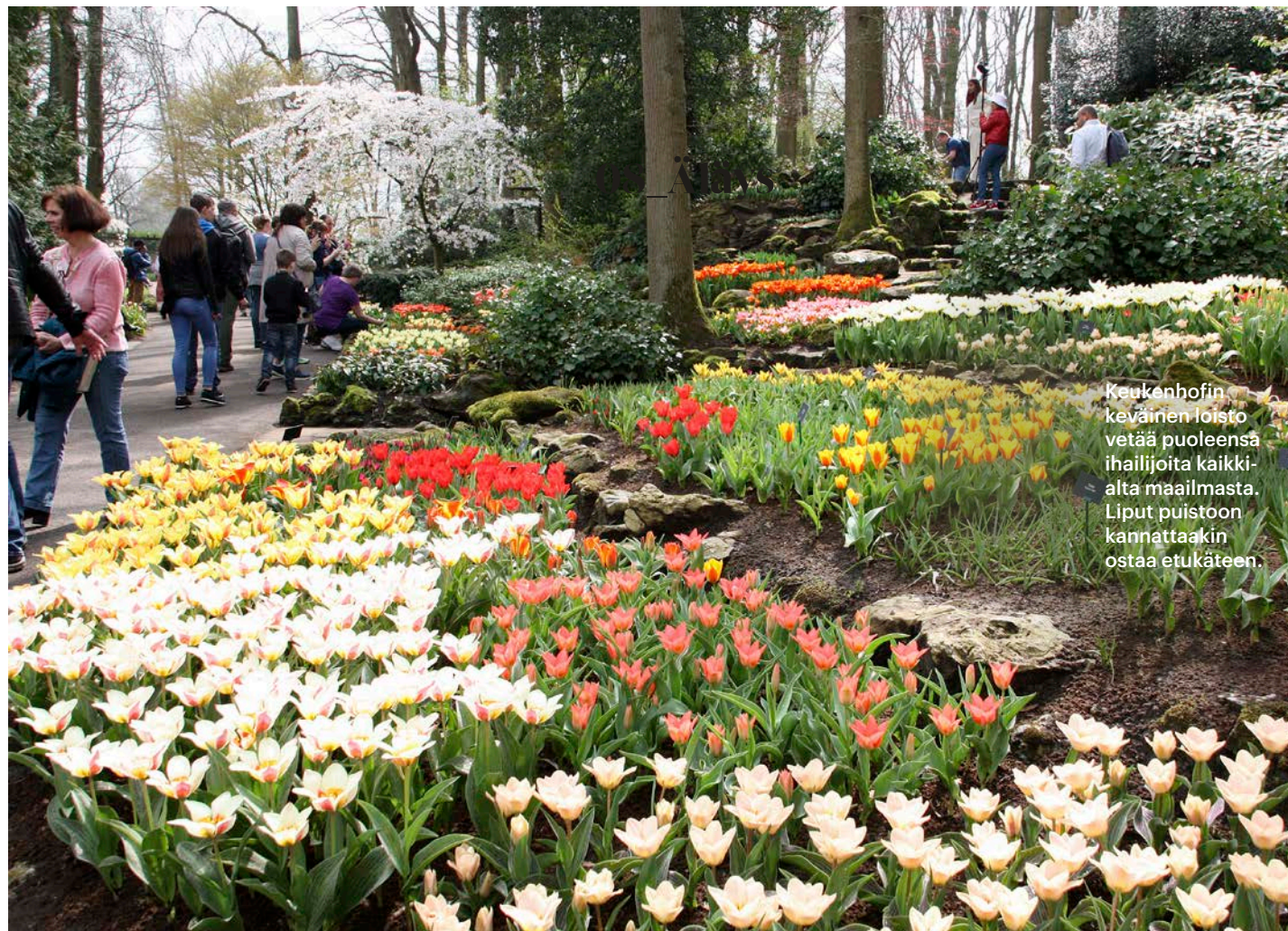
Keukenhofin keväinen loisto vetää puoleensa ihailijoita kaikkialta maailmasta. Liput puistoon kannattaakin ostaa etukäteen.